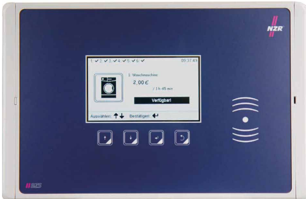
Abbildung: Großes Gehäuse