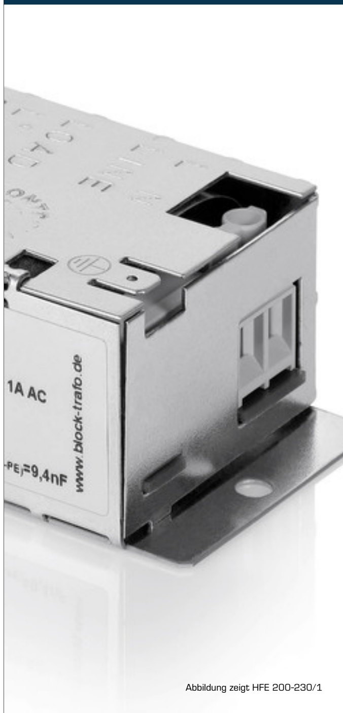
Abbildung zeigt HFE 200-230/1