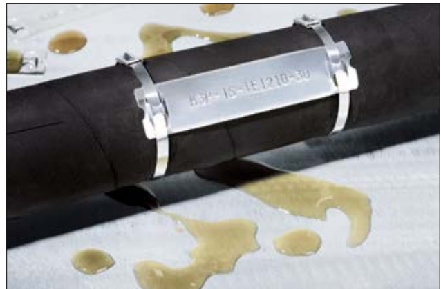
Kennzeichnung für extreme Umweltbedingungen: M-BOSS Compact Edelstahlmarkierer.