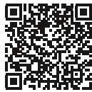
Anwendungsvideo: M-BOSS Compact